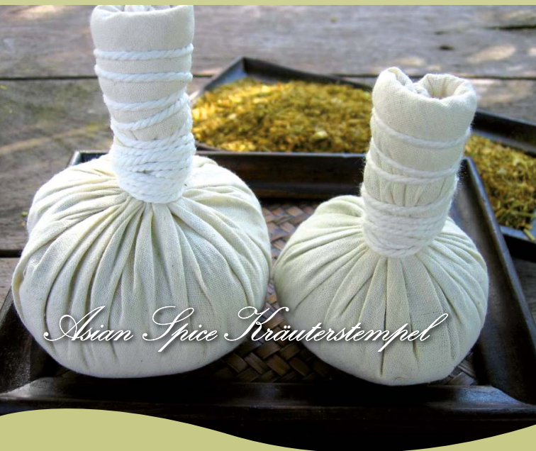
Asian Spice Kräuterstempel

2 Übernachtungen, Halbpension pro Person 245 € (reichhaltiges, vielseitiges Frühstücksbüfett und Abendessen im Rahmen der Halbpension)